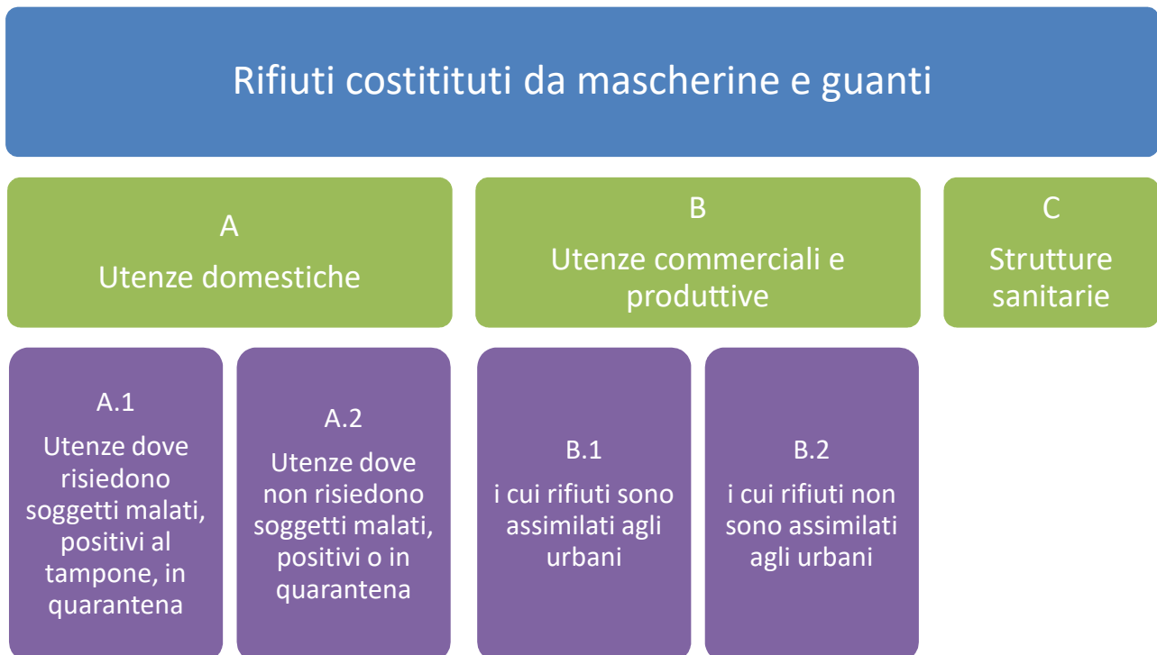
Figura 1 – Provenienze dei rifiuti costituiti da mascherine e guanti

Per la classificazione dei rifiuti di DPI prodotti dalle strutture sanitarie si fa riferimento a quanto previsto dal DPR 254/2003 e dalle Circolari del Ministero della Salute. Ad esempio, la Circolare prot. 5443 del 22 febbraio 2020, ha fornito indicazioni e chiarimenti, tra l'altro, in merito alla pulizia di ambienti non sanitari dove abbiano soggiornato casi confermati di COVID-19 evidenziando che “tutte le operazioni di pulizia devono essere condotte da personale che indossa DPI (filtrante respiratorio FFP2 o FFP3, protezione facciale, guanti monouso, camice monouso impermeabile a maniche lunghe, e seguire le misure indicate per la rimozione in sicurezza dei DPI (svestizione). Dopo l'uso, i DPI monouso vanno smaltiti come materiale potenzialmente infetto.” In tal caso la circolare chiarisce che i rifiuti devono essere trattati ed eliminati come materiale infetto categoria B (UN3291). Le possibili casistiche sono schematizzate in Figura 1.